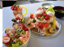
↑ ストレッチ体操教室 （2010年2月11日） 八戸市水産会館