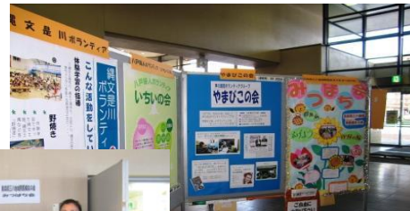
↑ 八戸市の市民活動団体パネル展 （2011年2月） 八戸市役所