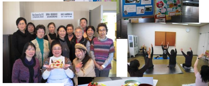
↑ 世界希少・難治性疾患の日（RDD2012） ちらし寿司作り交流会 （2012年2月28日） 八戸市総合福祉会館