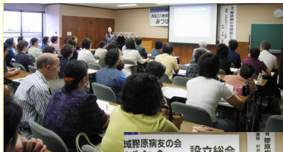
↑ 設立総会 （2010年9月11日） 八戸市総合福祉会館